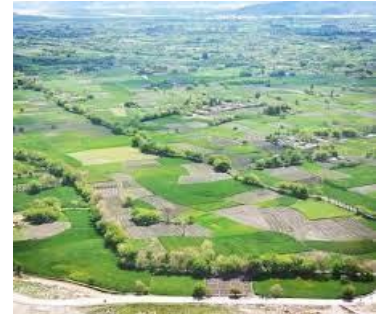
د افغانستان د ښکلي طبیعت درې ښکلي منظرې او زمور د پتمن او خواریکښ ولس کار او زیار