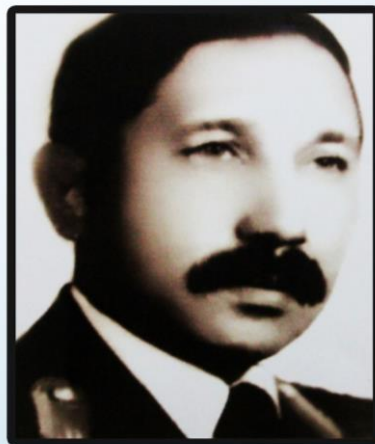
انجنیر شیر آقا حرکت ښاروال کابل