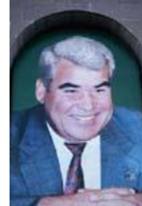
سپارمیراد نیازوف رئیس جمهور ترکمنستان

به محض اینکه اندیشه اعمار خط لوله گاز در اوایل دهه ۱۹۹۰ پدید آمد، شرکای امریکائی و پاکستانی موافقه نمودند که اعمار چنین پروژه زمانی امکان پذیر است که جنگ خونین در افغانستان پایان یابد. بعد از آنکه طالبان روی صحنه ظاهر شدند، چنین وانمود شد که آنها هستند که اسقرار را در این کشور تامین خواهند کرد. هر چند که صرف نظر از موفقیت های نظامی شان، جنگ در شمال کابل هرگز متوقف نشد. در اخیر ۱۹۹۷، امریکا قدم پیش گذاشت تا ابتکار مذاکره بین طالبان و ائتلاف شمال را در دست گیرد. در ماه نومبر، کمپنی یونیکال این ترتیب اثر را داد که یکی هیئت عالیرتبه طالبان از واشنگتن بازدید نماید. در اثنای ملاقات با آنها، موضوع اعمار خط لوله گاز و همچنان سوال مذاکرات بین الافغانی در آینده مورد بحث قرار گرفت. بعد از برگشت هیئت طالبان به قندهار، الزواهری آمادگی حمله به سفارت خانه های امریکا در افریقا را گرفت. از این جاست که حوادث طبق نمایشنامه امریکا آشکار میشود.