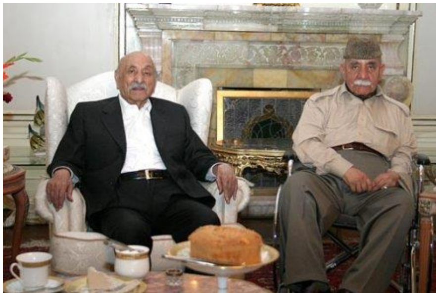
سردار ولی با شاه سابق

سردار عبدالولی در برگشت به کشور در پوست های نظامی قوماندان تولى قلعه جنگی، قوماندان کندک، رئیس ارکان قول اردوی مرکزی و سپس تا کودتای ۲۶ سرطان سال ۱۳۵۲ به صفت قوماندان قوای مرکز اجرای وظیفه نمود. پس از کودتای سرطان برای مدتی زندانی و توسط یک محکمه نظامی محکوم به مرگ شد ولی به امر سردار داؤد خان بعد از رهایی اجازه یافت نزد پادشاه سابق به کشور ایتالیا برود. موصوف در ایتالیا بحیث مشاور ارشدو سخنگوی محمد ظاهر شاه ایفای وظیفه نموده و در دوران اداره موقت حامدکرزی یکجا با مرحوم ظاهرشاه در سال ۱۳۸۱ به کشور برگشت و سالهای اخیر زندگی اش رادر حرم سرای ارگ ریاست جمهوری سپری نمود. وی همچنان از سوی رئیس جمهور کرزی رتبه سترجنرالی را دریافت کرد و به مدال عالی دولتی هیواد مفتخر شد.