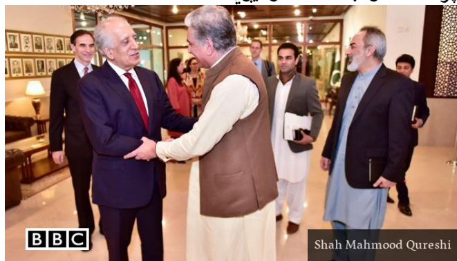
Shah Mahmood Qureshi

د پاکستان د ستراتیژیکه مطالعاتو له مخې، د پاکستان په ستراتیژیک ژورتا به یا عمق کې افغانستان د پنځمې صوبې اعتبار لري، پاکستان د همدې ستراتیژیک عمق Strategic depth له مخې په افغانستان کې د دريو لسیزو په بدو لوبو کې د مخکښ نقش لري، دا چې دا بحث ډیر ژور ابعاد او اوږد تحلیل لري زه یې په همدې اختصار اکتفا کوم، بل دا چې پدې لیکنه کې کوشش کوم له پاکستان سره د رغنده امکاناتو او فرصتونو په راسپړلو سره غواړم د اصلاح، سمون او د گډو گټو په موندلو سره مثبتې نتیجه وړاندې کړم، دواړو هېوادونو ته امیدبښوونکي وي، نو ځکه له اصلي